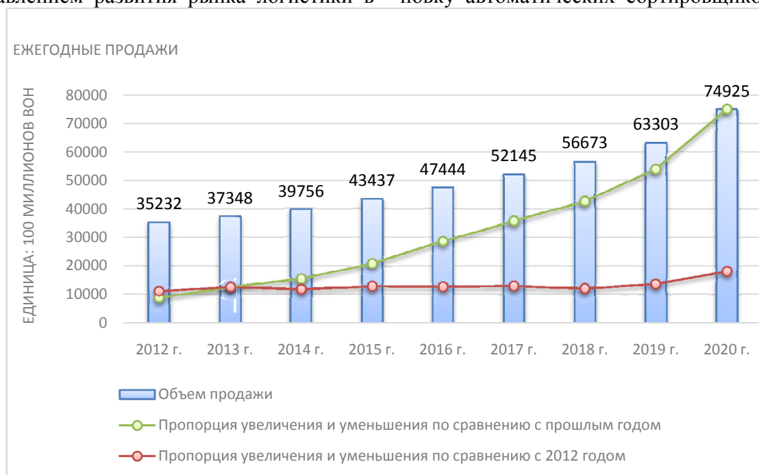
Рис. 1. Тенденция продаж товаров через интернет-рынок

Кроме того, «CJ Logistics» постоянно инвестирует денежные средства в установку автоматических сортировщиков на